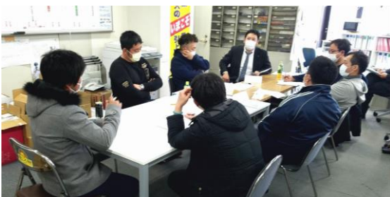
分散会では熱い議論が交わされる

三月七日、本部青年部総会とあわせて、本部青年部拡大出陣式を行いました。コロナ禍ということもあり、規模を縮小しての開催でしたが、分散会が行われて、『コロナ禍での組合の活性』や『青年技能競技