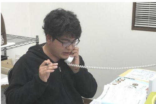
支部事務所にて、皆さんへ向けて電話かけ(写真左)

最近はずいぶん暖かい日も増えてきました、いよいよ春の拡大月間が始まります。緊急事態宣言が解除されましたが、今期もコロナに気を付けながらの、拡大月間となります。昨年の拡大月間より、組合員の皆さんに電話をかけてから、現場で未加入者に、配ってもらう拡大グッズ等を持って、訪問させてもらっています。