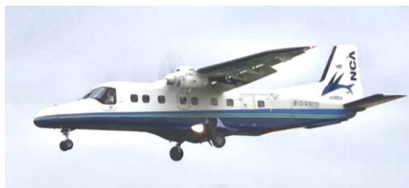
上空を飛ぶドルニエ228型機