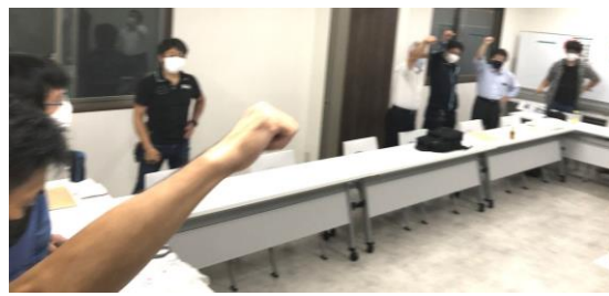
拡大出陣式にて、目標達成に向けてガンパロー