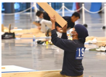
真剣なまなざしで材料と向き合う

今年度の技能競技大会も昨年同様、無観客の中、動画配信が行われ、画面の向こうから応援していました。