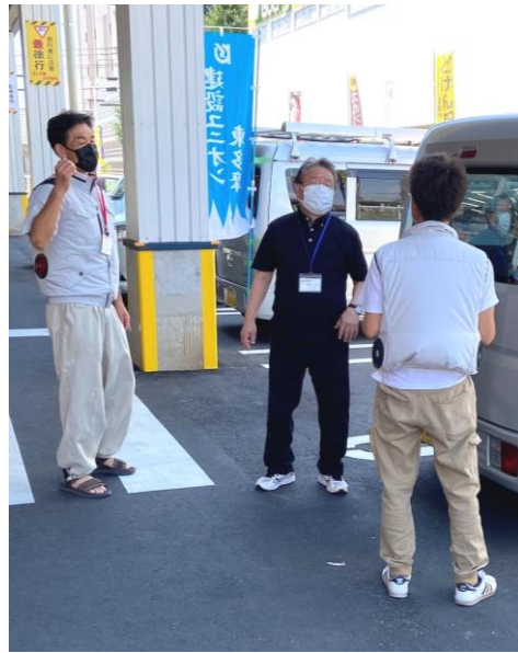
買い物を終えたお客さんに声掛けの様子

いよいよ秋の拡大月間が始まります。今回東多摩支部で初の試みとなる、コーナンプロ府中甲州街道店と、コーナンプロ三鷹東八店二か所にユニオンの宣伝、拡大行動に行ってくださいました。