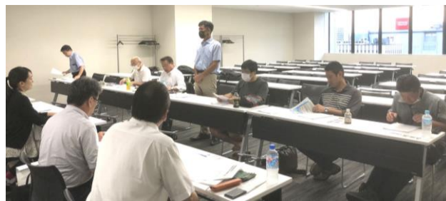
各地域の情勢について議論を交わす

八月四日、午後六時から府中駅前『市民活動センタープラッツ』にて、推薦議員等六名と、支部から九名の合計十五名で懇談会を開