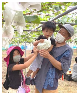
マスカットが大きく持ちきれない!

九月二十五日、三年ぶりとなる、バスツアーが開催され、埼玉県秩父へ、シャインマスカット狩りに行きました。今回は感染対策として、人数を少し制限した中での開催となりましたが、総勢八十四名の方に参加いただきました。 初めは花園フォレストで、お買い物。クッキーの詰め放題がとても人気で、豆乳ソフトクリームもおいしくて おすすりめです。買物の後は長瀬の古沢園で昼食。豊かな自然の中、BBQを食べました。 秩父名物の味噌ポテトも付いて、お肉もおいしく、みんな大満足でした。 そしてメインのシャインマスカット狩りへ。会場では沢山のシャインマスカットがなっていて、子供達も楽しんで狩って食べています。