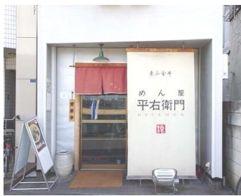
めんや平右衛門入口正面

今回は東小金井駅南口から徒歩二分。日本歯科大学ラグビーグラウンドそばにある、めん屋平右衛門(めんや