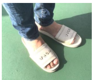
旅の記念品かなや丸サンダル