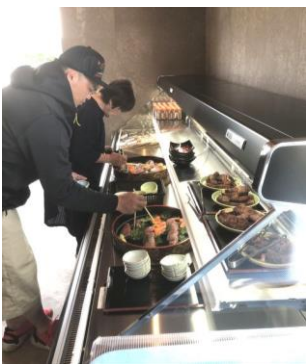
旬の刺身は食べ放題

普段乗らないフェリーの上が、普段起きないことが起こる。バスをフェリーに乗せ、デッキへ上る階。この他、記事には書ききれない程、盛り沢山のイベントで、大人も子ども笑顔あふれるレクリエーションに。