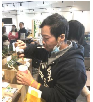
自分だけのはちみつソフト

四月二十三日、千葉県は君津市方面で総勢八十名にて、支部レクリエーションとして、いちご狩りバスツアーを開催しました。春らしい陽気の中、渋滞もなく順調に向かう先は支部レクリエーションで何度もお世話になっている渡邊いちご園さん。食比べのできる二種類のいちごは、どちらを食べたいかというアンケートを実施。その結果、いちご園からバスで五分、はちみつ工房では、遠心分離機を使ったはちみつ採取を見学。工房内では、いろんな種類のミードやシユースの試飲。はちみつかけ放題のソフトクリームにはそれぞれの好みに合わせて。