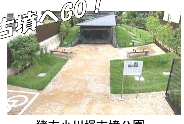
猪方小川塚古墳公園