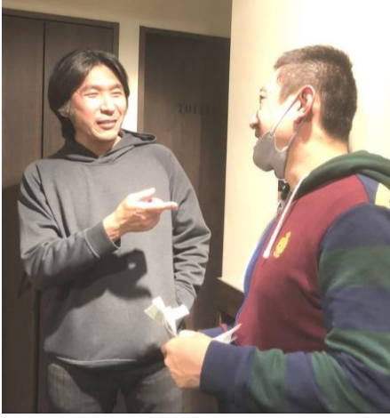
みんな揃って記念撮影(写真上) 久しぶりの再会に話の花が咲く(写真下)