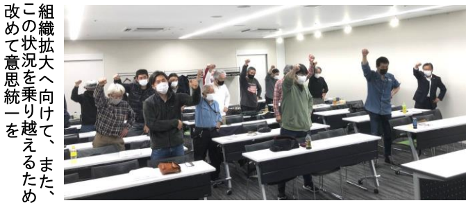
組織拡大へ向けて、また、この状況を乗り越えるため改めて意思統一を

石綿障害予防規則の改正により、床面積の合計が八十平米以上、請負金額百万円以上の改修工事を行う際、アスベストの有無に関する調査結果等の届け出が義務付けられる。 令和五年十月より、この調査を行うために は『建築物石綿含有建材調査者』の資格を取得している必要がある。今後、この資格を持つているか否かにより、該当する改修工事において、調査待ちとして工事行程の調整を余儀なくされるか、新たに石綿含有調査の仕事を取れるようになるか、差がつく時期がくるかもしれない。