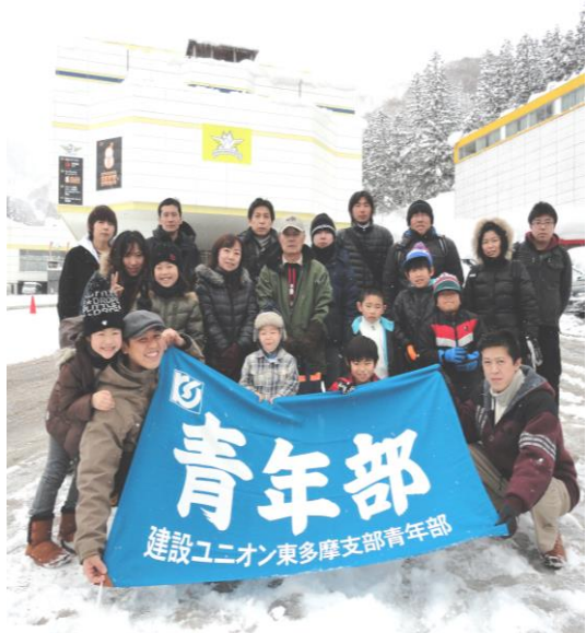
設立当時『のびのび』掲載の新潟スキーツアー