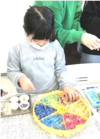
素材選びに一生懸命

一月二十九日支部事務所にて、キャンドルづくりを行いました。家族四組が参加し、色とりどりの材料から、思い思いの素材を選び、自分だけのキャンドルを作っていました。合間には、東府中駅前のイタリアンVAN SANでランチ会。初めて会った子供同士も