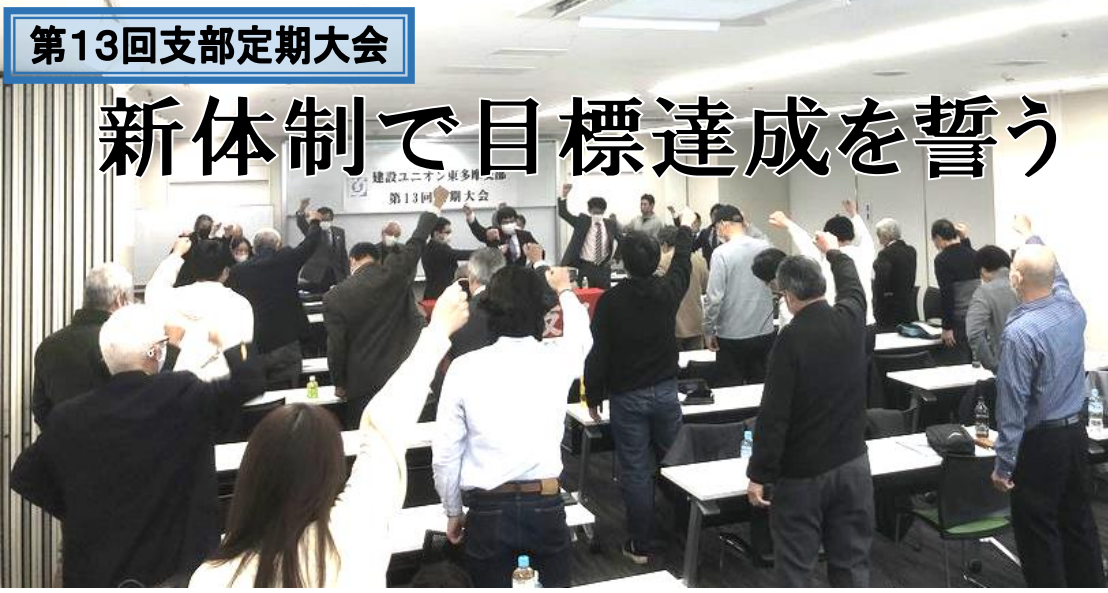
第13回支部定期大会