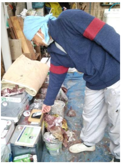
カードリーダーにて認証している様子(写真上・右)

この現場では足場に 備え付けているカード リーダーに、キャリアア ップのカードを認証 させての現場入場。 今年の仕事始めは、 三鷹市中原にある個人 宅の外壁塗替え工事で、 iPadとユニオン本 部より貸してもらえ るカードリーダーを使 い、現場入場。カード の登録をしてから、少 しずつカードを活用す 現場が増えてきていま す。これからは町場の 現場でも普通にキャリ アップのカードを使 うようになってきます。 そんなときに備え、ま だ登録していない方は 技能者登録をして、ゼ ビカードを所得して ください。