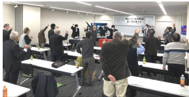
目標達成に向けて ガンバろう三唱 （写真左）