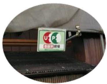
現場にはCCUS運用ポスターを掲示