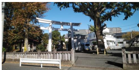
世田谷区勝利八幡神社の白い鳥居

日本古来の神様を祀る神社。そこにある鳥居には朱色に塗られている物が多く見られます。なぜ鳥居が朱色に塗られているか、ご存知です