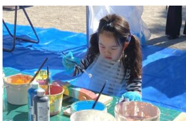
マイカーの配色に集中