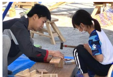
狙いを定めてコンコン