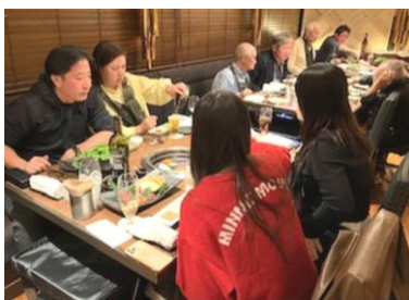
仲間と家族と親睦を深める