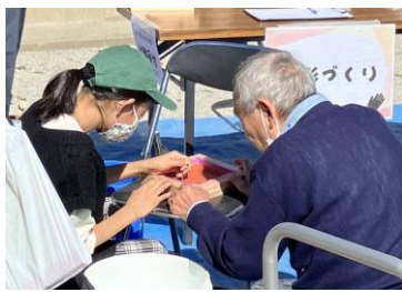
記念に手形プレートづくり