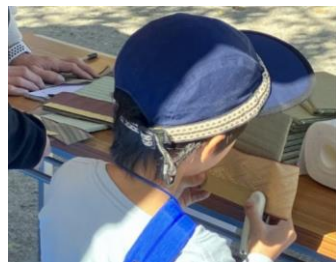
ミニ畳のヘリを選定中