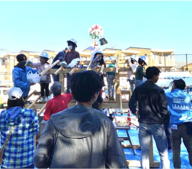
家の建て方やお菓子まき(本来は餅まき)を体験(子供上棟式)

発行 首都圏建設産業ユニオン 東多摩支部 教宣部 府中市若松町2-3-28 Tel:042-354-8055 発行責任者 山本 武善