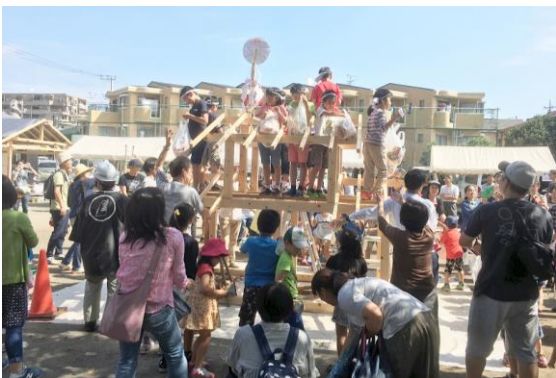
前回の支部住宅デーの様子(子ども上棟式)