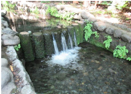
四季折々の自然の中、澄んだ 湧水の景色が楽しめます

JR西国分寺駅から 歩いて十二分ほど。国 分寺市の住宅地の中に 『お鷹の道・真姿の池 湧水群』があります。 江戸時代にあった鷹 場にちなんで、湧水が 注ぐ清流沿いの細い道