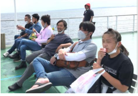
フェリーにゆられ、海上で談笑

次は秋のシャインマスカット狩りです。レクリエーションに参加した事ない方や、組合未加入の方も誘いあい、ぜひご参加ください。 【山本 武善・記】