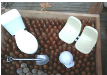
ちょっとシュールなどんぐり広場

どんぐりの季節には、シイ、クヌギ、コナラ、シラカシと四種の実が落ちる。佃煮が入っていたような箱に、それらのだんぐりを種類ごとに並べ、ボンドで固定する。『どんぐりハウス』の出来上がり。ドイツではこのようにして秋から冬のクリスマスまで楽しむのだ。 今年は、ちょっとシュールな『どんぐり広場』も作り、保育園の子どもたちを迎えた。どんぐりの上に鎮座するトイシの姿に好奇心旺盛な子供たちの目が輝く。先生が見守る中、一人ずつトイシのふたを開けていく。中にはコナラのだんぐりが一つ。