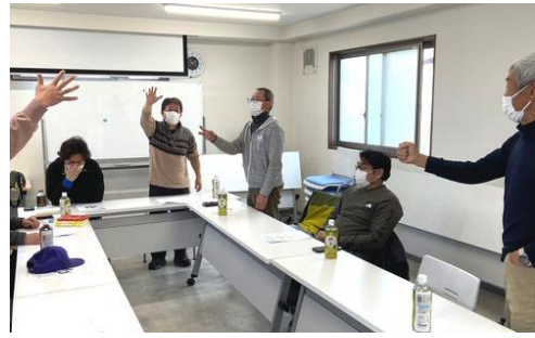
抽選会では真剣勝負

十二月十一日、支部事務所三階会議室にて、昨年加入した初参加者も迎え、七名の参加で地区総会を開催。内容としては一年間の活動報告、会計報告、来年に向けての地区行動予定の確認など、議案の内容に沿って進めていきました。