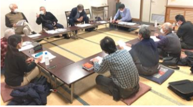
規約を改め、議論に集中

十二月十一日、地区総会を開催しました。前半は昨年度の行動や取組、会計報告が行われました。拡大率、国保要請ハガキ達成率では支部トップを達成。後半は今年度方針案を決定しました。