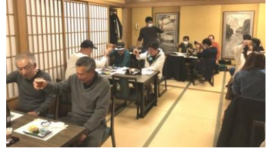
三年ぶりの忘年会に乾杯

十一月十三日に地区で大人気、熟成焼肉工イシングレブフでレクリエーション、十二月十日に仙川駅近くの三進にて総会を開催。