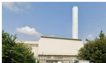
クリーンプラザふじみとそびえたつ『エントツくん』