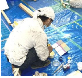
限られた塗料で見本板に合わせ調色(写真上) 調色した塗料を図面に合わせ塗装(写真左)