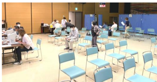
新型コロナウイルス感染対策の為、受診者間の間隔をあけ開催（6月6日開催時の様子）

受診の順番は申し込み順となります。送付される『健康診断時実施のご案内』をご確認の上、早めのお申し込みをお願いします。