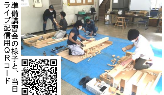
準備講習会の様子と、当日 ライブ配信用QRコード