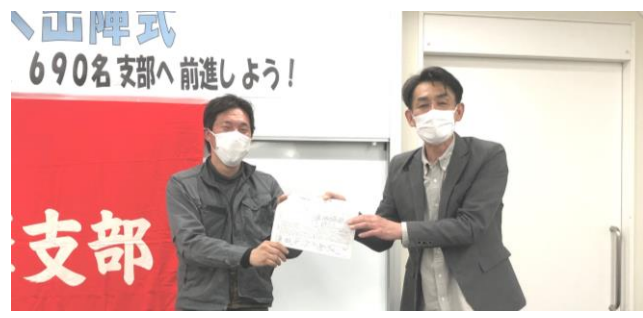
拡大出陣式当日に組合加入の報告