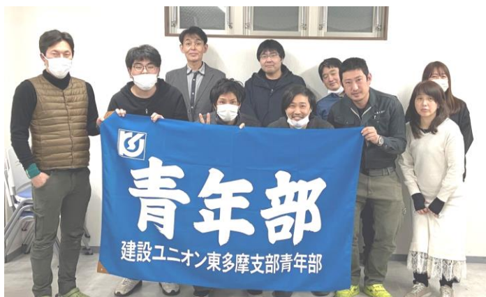
一同息を止めての記念撮影

三月二十二日、まだまだコロナも収まらぬ中ではありますが、今年も支部青年部総会を開催いたしました。 この総会開催にあたり、企画時点では会場を『木曾路』として、より多くの方へ周知、呼びかけを行い、おいしいものを食べながら大々的な開催を想定し