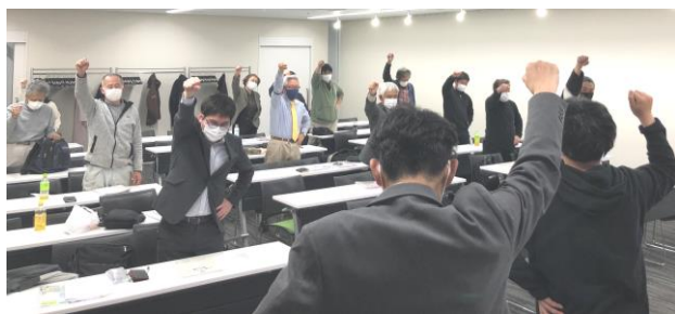
目標達成に向けてカンパロー

今年も春の拡大月間が始まりました。東多摩支部の組織数は、四月一日の時点で683人となっており、期首組織と同数となっています。コロナ禍で活動が制限される中で、各地区では電話かけ行動を設定し、早くも二地区がスタートしました。未加入者情報の聞き取りだけでなく、大气污染防治の改正に伴う、石綿含有の事前調査や、来年十月より影響が出るのインボイス制度、建設キャリアアップシステムの登録や活用等、変わりが多くなる時期です。健康診断の開催、企業交渉の取り組みの周知の他、「賃金アンケート」や「拡大グッズの現場配布」の協力をお願いしました。年度替わりのこの季節は、特に人の入れ替わりが多くなる時期です。現場で組合に入っていない仲間を見かけたら、建設ユニオンのメリットをPRし、労災保険への加入をはじめとした、困りごとを抱えている仲間がいたら「ユニオンに相談してみたら」と、ひと声お声掛けをお願いします。一人でも多くの仲間を増やし、皆さんで東多摩支部を盛り上げていきましょう。ご協力、よろしくお願いたします。